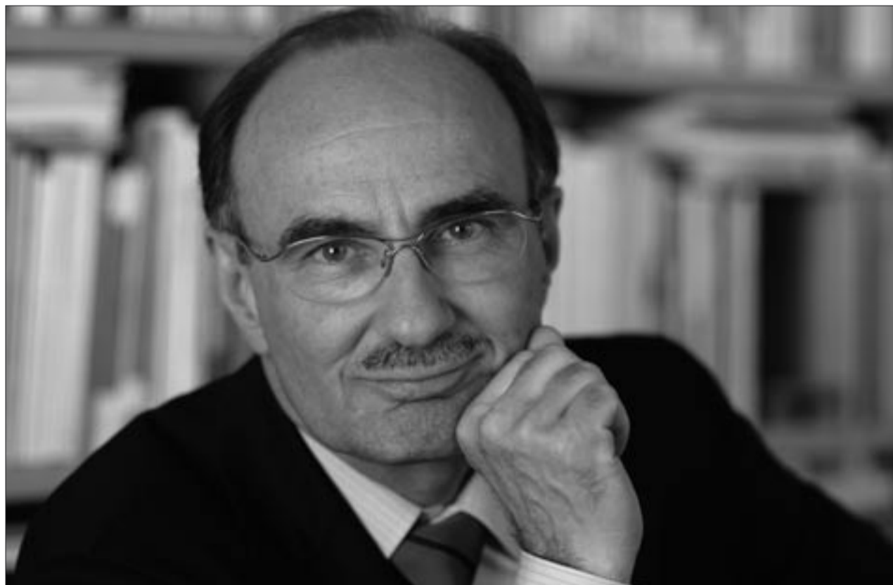
Setzt sich im Parlament für ein umfassendes Rauchverbot an Arbeitsplätzen und im öffentlichen Raum ein: Nationalrat und Präventivmediziner Professor Felix Gutzwiller

Sie argumentieren, dass mit Verboten in der Gastronomie nicht nur das Personal geschützt würde, sondern sich