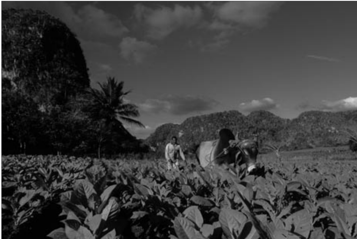
Tabakfelde in Pinar del Rio