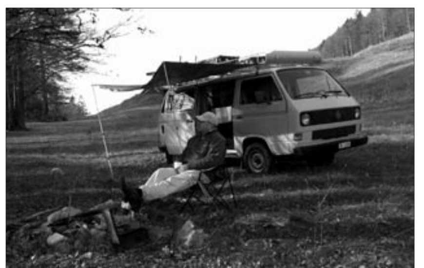
Die kleine Freiheit am Grencherberg

Lassen sie freitags den Stift schon um 15.00 Uhr fallen, sagen sie ihrem Chef, sie hätten eine Vorsorgeuntersuchung beim Arzt. Er wird ihnen verständnisvoll zunicken, auch er ist schon über vierzig und weiss, wie wichtig solche Untersuchungen sind. Dann fahren sie auf direktestem Weg nach Birrfeld, auf den Hasenstrick oder meinetwegen zu Ruedi Röschi nach Gstaad, rufen ihn von unterwegs an und fragen ihn, ob er noch einen Platz in seiner Piper frei habe, sie wollten noch ein wenig gegen den Himmel steigen. Und wer weiss, vielleicht dreht er seine Runden genau so, wie ihr innerer Adler es tun würde. Oder verkaufen sie endlich die alte Bernina Nähmaschine ihrer Grossmutter auf Ricardo.ch und bezahlen vom Erlös die Weekend-Miete für ihr Reise-