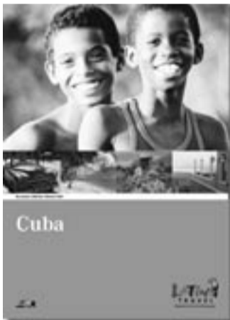
Cuba-Katalog von Latino Travel

Weitere Informationen finden Sie unter www.latinotravel.ch .