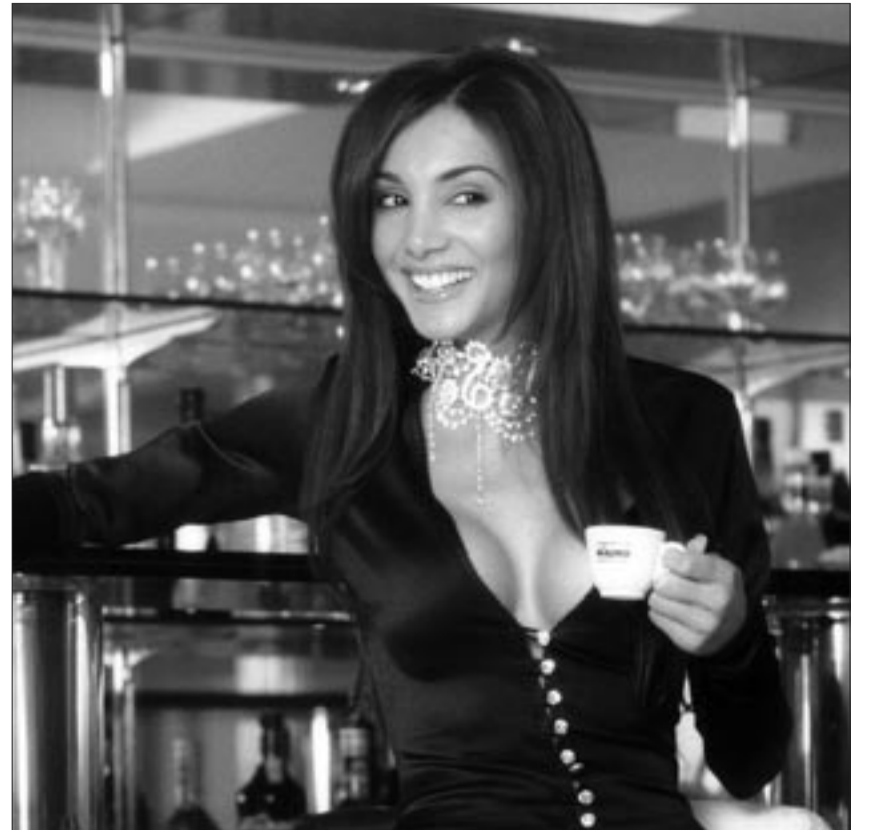
Caffè Mauro – mediterraner Espresso-Genuss (Bild zvg)